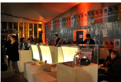
(6) altonale DESIGNgift-Markt, 26.+27.11.2011