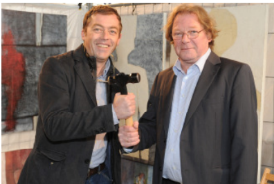
(1) Offizielle „Staffelübergabe“ am 19.11.2011

Liebe Leserinnen und Leser, nach längerer Pause melden wir uns mit dem altonale newsletter wieder zu Wort. Es hat sich viel getan: Seit dem 1. Oktober lenkt ein neuer Geschäftsführer die Geschicke der altonale , damit zusammenhängend werden neue Konzepte entwickelt, vor allem für das Straßenfest gibt es viele neue Ideen. Die altonale arbeitet zudem in einem neuen, viel zentraler gelegenen Büro in Altona-Altstadt (Große Bergstraße, neben der IKEA-„Baugrube“) und last but not least hat die altonale in Zusammenarbeit mit DESIGNgift ein neues Veranstaltungsformat entwickelt – den altonale DESIGNgift-Markt. Viel Spaß beim Lesen!